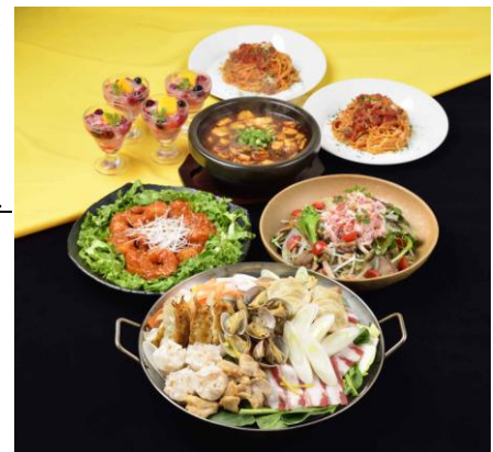
プレミアムセレクションコース

この「楽しみ蒸」は、白菜などのたっぷりの野菜、イベリコ豚、鶏肉、あさり、そして鍋料理には珍しい小籠包、焼き餃子、焼売などの点心を一度に蒸し上げ、さまざまな味を「楽しめる」蒸し鍋となっています。ポン酢ともみじおろしをつけてさっぱりと召し上がっていただける、春夏の季節にぴったりの鍋料理です。