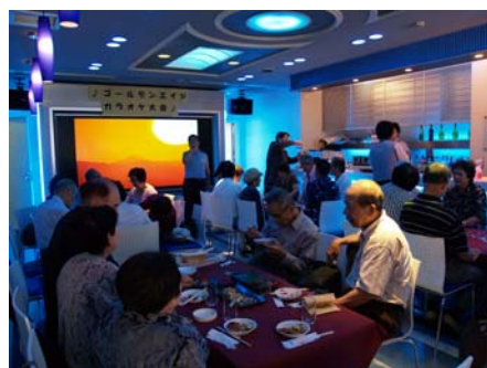
2007年ゴールデンエイジ・ カラオケ大会の様子