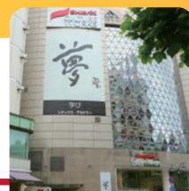
シダックス カルチャービレッジ