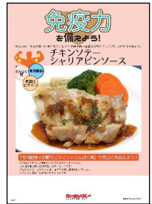
免疫力がテーマのメニュー