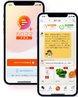
健康アプリ 「カロママ プラス」

新型コロナウイルスの影響で、日々の健康管理の大切さにより関心が高まる一方、在宅勤務やオンライン授業なども日常的に行われるようになってきました。また、企業が「健康経営(※1)」に取り組むことが当たり前になり、経済産業省の認定制度「健康経営優良法人(※2)」も年々認定企業数が増えています。シダックスではこのニューノーマル時代においても、食を通して受託先のお客様の健康サポートをするべく、以下の4つのサービスを提案します。