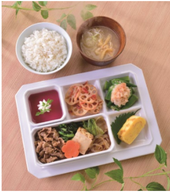
栄養バランスの取れた 「スマートミール」の提供

総合サービス企業 シダックスグループは、全国で受託運営する社員食堂・学生食堂等のお客様に向け、栄養に関する情報やアドバイスが受けられるサービス、日々の健康管理ができる健康アプリのご提案など、食堂利用にとらわれない健康サポートを、2022年6月より強化してまいります。