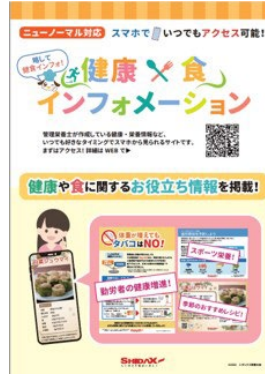
管理栄養士が発信する 健康情報サイト