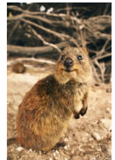
オーストラリア・ロットネスト島

オーストラリアの西海岸都市・パースから20Km離れたインド洋に浮かぶロットネスト島へフェリーに乗って観光するリモートツアー。美しい海と共に、世界一幸せな動物の愛称で知られる「クオッカワラビー」も楽しめる。