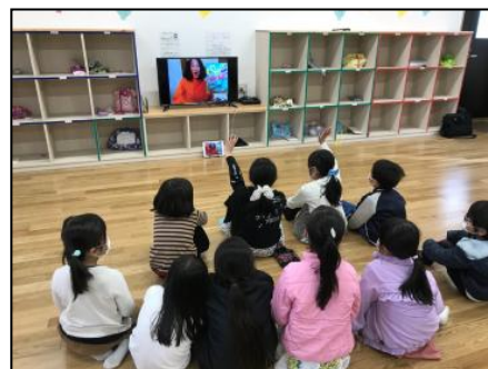
タイトル画面(上)と、専用端末による施設内での視聴時の様子(イメージ)