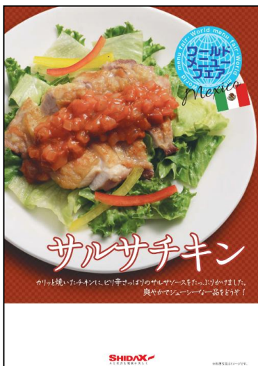
「サルサチキン」ポスター

酸味と辛味が効いたトムヤムスープに中華麺が絡み、パクチーの爽やかな風味も味わえる、タイ旅行気分が味わえる一品。