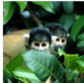
ボリビア・アマゾン地域

南米ボリビア・アマゾン地域のルレナバケを出発点とし、ジャングル(マディディ国立公園)やパンパス(湿地帯)を観光するリモートツアー。日本では見ることのできない動物や植物、昆虫も楽しめる。