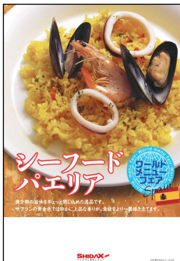
「シーフードパエリア」ポスター