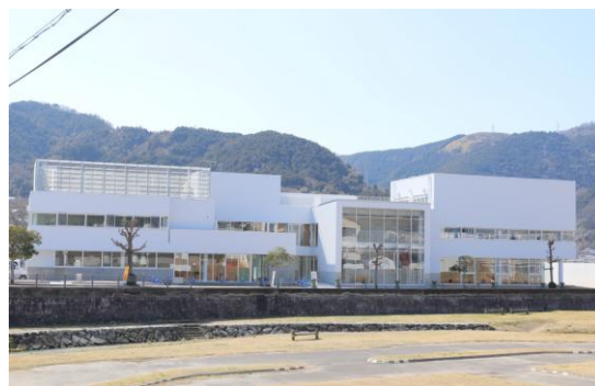
外観(児童会館、水辺のプラザ)