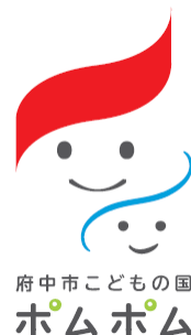
府中市こどもの国 ポムポム

<正式名称> 府中市こどもの国ポムポム <運営開始日> 2018年4月1日(日) ※2018年3月25日(日)プレオープン <指定管理期間> 2018年4月1日(日)~2022年3月31日(木) <住所> 〒726-0021 広島県府中市土生町 1581-7 <TEL> 0847-41-4145 <営業時間> 9:00~18:00 <休館日> 木曜日、年末年始 ※木曜日が祝日の場合、翌水曜日 <敷地合計面積> 11,457.50 m 2 <受託運営会社> シダックス大新東ヒューマンサービス株式会社 <URL> https://kodomo-fuchu.com