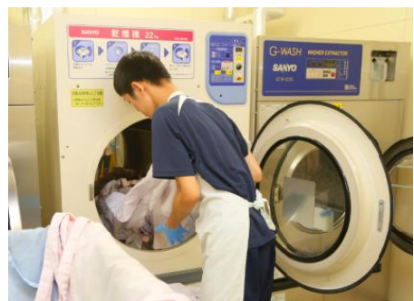
グループ内事業会社(シダックス大新東ヒューマンサービス株式会社)が運営を受託する施設にて業務を行う様子