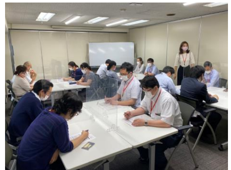
テーマ設定による定期ミーティングの様子

※はいずれも、独立行政法人 高齢・障害・求職者雇用支援機構(厚生労働省所管) 主催