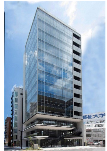
「Commune Plaza」が入居する UPROVEMENT 外観