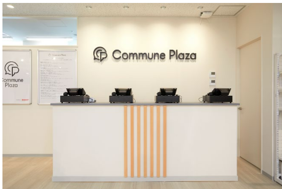
「Commune Plaza」内観(レジスペース)