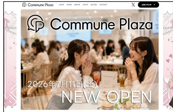
公式 WEB サイトトップ画面（イメージ）

SCP は、シダックスグループ初となる直営の IP エンターテインメント施設「Commune Plaza」を、ファンが集い、熱量を高め合える「ファンコミュニティのプラットフォーム」を目指し、多くの作品ファンが集まる池袋に、7月11日（土）オープンします。これに先駆け、施設の詳細や開催タイトルの最新情報等をお伝えする公式 WEB サイト ( https://commune-plaza.com/ ) を開設しました。 毎月1回のペースで新たなタイトルを展開し、訪れるたびに新しい感動と出会える、ファンの皆様が何度も足を運びたくなる拠点としてのスタートを切ります。