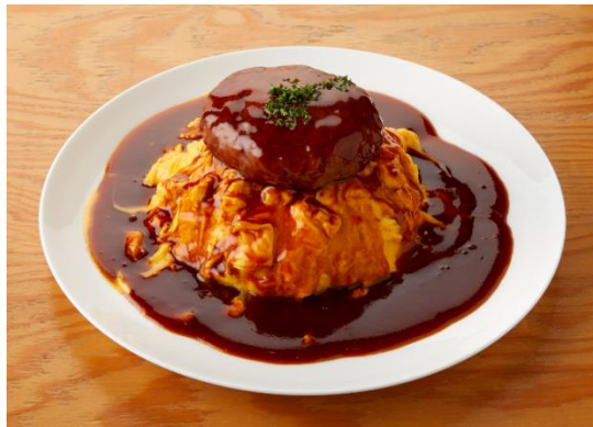
「SACULA DINER」提供メニュー 「ミュージアムオムバーグ」

角川武蔵野ミュージアムは、株式会社 KADOKAWA が運営する日本最大級のポップカルチャー発信拠点「ところざわサクラタウン」内に2020年11月にグランドオープンした、図書館、美術館、博物館が融合する文化複合施設です。「SACULA DINER」と「Kado Cafe」は、角川武蔵野ミュージアム内に設置され、オープン当時から施設を利用する方々に親しまれてきました。オープンから約6年が経ち、この度「SACULA DINER」については、幅広い年代のお客様により一層お楽しみいただける店舗に生まれ変わるべく、コンセプトを含めたリニューアルを実施。SCP が店舗の受託運営を開始する運びとなりました。