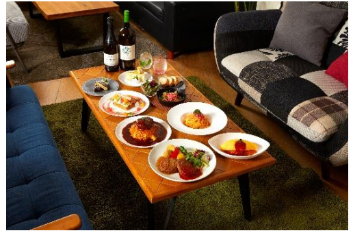
ソファー席でのお食事イメージ