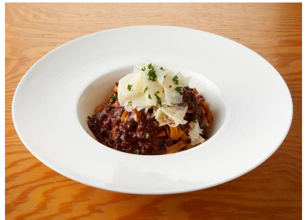
ミュージアムボロネーゼ(1,980 円)

特製オムライスの上にジューシーなハンバーグを贅沢に組み合わせた洋食のハイブリッドメニューです