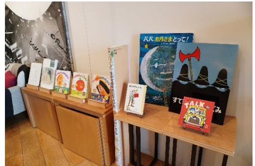
お子様向けの大きな絵本もご用意