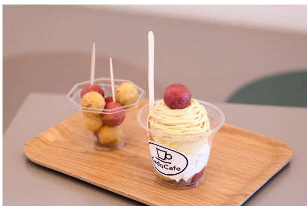
(写真左より)おいもボールプレーン(8個/620円) おいもモンブラン(650円)