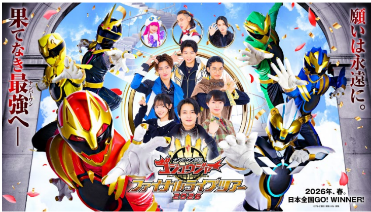
「ナンバーワン戦隊ゴジュウジャー ファイナルライブツアー2026」 メインビジュアル