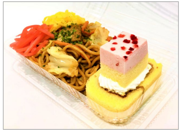
キッチンカー提供メニュー(イメージ)

本イベントは、2025年2月から2026年2月までテレビ放送された、スーパー戦隊シリーズ50周年記念作品「ナンバーワン戦隊ゴジュウジャー」の番組キャストが全国各地を巡り、主演キャストによるオリジナルストーリーのヒーローショーやトークショー、キャラクターソングのライブなど、作品の世界観を直接体験できる貴重な機会となっています。