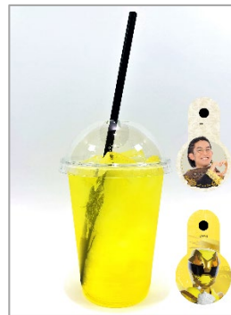
ゴジュウティラノソーダ