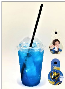
ゴジュウレオンソーダ