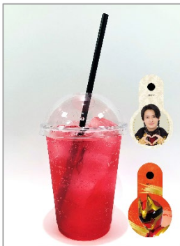
ゴジュウウルフソーダ