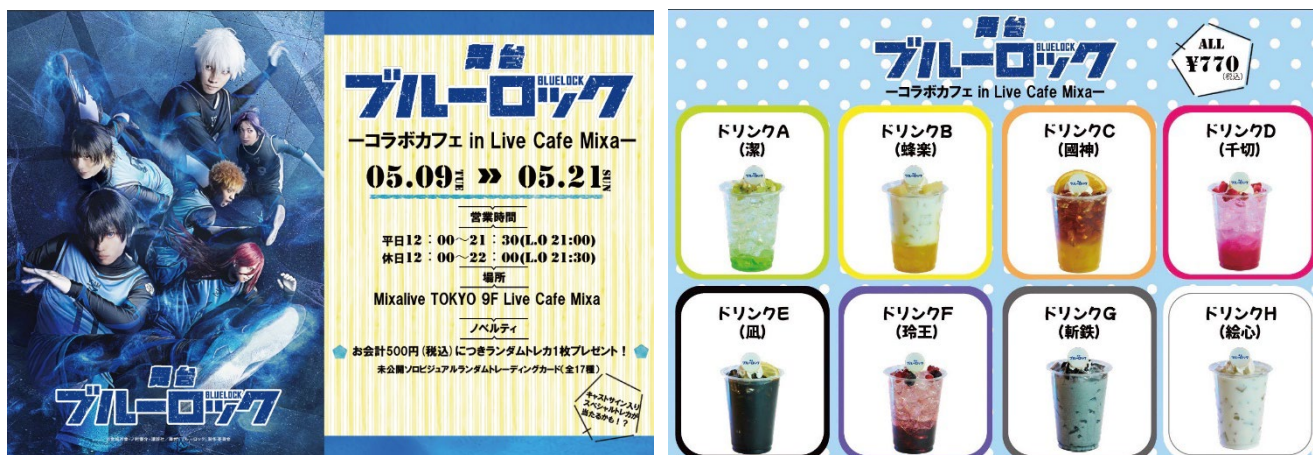
舞台『ブルーロック』コラボカフェ メインビジュアル ©金城宗幸・ノ村優介・講談社／舞台『ブルーロック』製作委員会

総合サービス企業 シダックスグループが受託運営するLIVE エンターテインメント複合施設「Mixalive TOKYO(ミクスライブ東京)」(東京・池袋)内のカフェ「Live Cafe Mixa」にて、舞台『ブルーロック』のコラボカフェを、2023年5月9日(火)～5月21日(日)の期間限定で開催します。