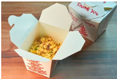
BOX 炒飯/1,100 円(税込)