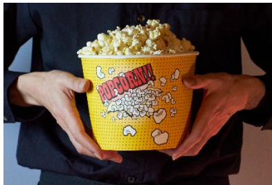
シアターボリューム ポップコーン 990 円(税込)