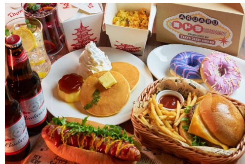
海外ドラマ“あるあるメニュー”(イメージ)

「Live Cafe Mixa」では、様々な作品の世界観に没頭できる“五感で体験するライブカフェ”を展開しています。今回は日本初、同カフェでも初の取り組みとなる、海外ドラマをコンセプトにした「ARUARU 海ドラ Diner」を開催。店内では、海外ドラマ史上に名を残す名作や最新作のポスター約90作品(述べ約100枚)がひしめく、独特な世界観を演出します。また、50作品以上の予告編も上映。さらに、メイク、ファッション、インテリアデザイン、DVDメーカーなど、様々な分野の専門家が海外ドラマについて語るトークコンテンツ「〇〇から見る海外ドラマあるある TALK」も、店内のみで上映します。