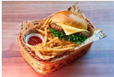
ダイナースタイルハンバーガー & フライドポテト/1,320 円(税込)