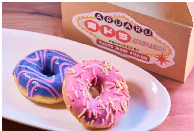
アメリカドーナツ(2 個)/770 円(税込)