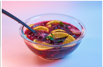
パンチボウル(パーティーサイズ) 1,650 円(税込)