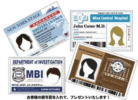
お客様の顔写真を入れて、プレゼントいたします!