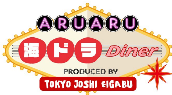
「ARUARU 海ドラ Diner」メインビジュアル

総合サービス企業 シダックスグループが受託運営する LIVE エンターテインメント複合施設「Mixalive TOKYO(ミクスライブ東京)」(東京・池袋)内のカフェ「Live Cafe Mixa」にて、 日本初の海外ドラマコンセプトカフェを、映像コンテンツの楽しさを伝えるべく活動している「トーキョー女子映画部」のプロデュースにより、2023年3月10日(金)～4月9日(日)の期間限定で開催します。