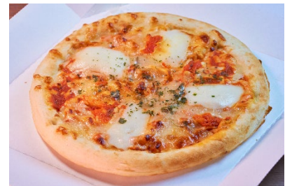
デリバリーBOX ピザ(マルゲリータ) 1,210 円(税込)