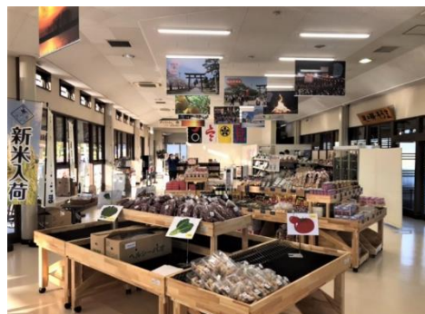
施設内館(リニューアルした農産物販売コーナー)

道の駅そうまは、2003年にオープン。福島県相馬市の東南端、国道6号線沿いに位置する道の駅です。2022年4月に一時閉館し、この度内装の改装工事を行い、新たにリニューアルオープン。これを機に、SDHが指定管理者となり、施設の受託運営を行います。