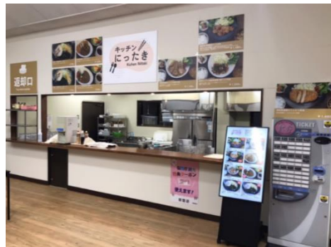
リニューアルしたレストラン 「キッチンにっつき」