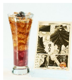
「復讐の怪人」 ※写真はソフトドリンク