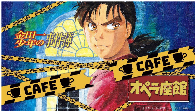
メインビジュアル

本コラボカフェは、全国各地で行われている人気のコンテンツ“リアル謎解きイベント”の形式を取り入れています。『金田一少年の事件簿』のコラボカフェは、今回が全国初となります。