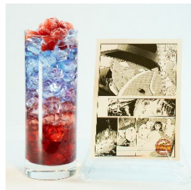
「美雪の悪夢」 ※写真はアルコールドリンク