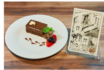
「1組の足跡」 990 円(税込) 「オペラ」という名のケーキの皿にココアパウダーで足跡を再現