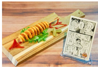
「放たれたボーガン」 990 円(税込) ボーガンに見立てたトルネードポテト