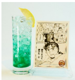
「金田一の閃き」 ※写真はアルコールドリンク