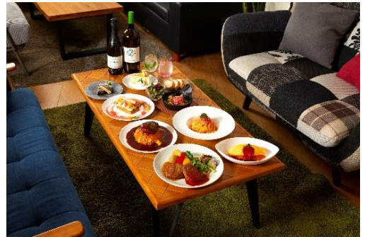
ソファー席でのお食事イメージ