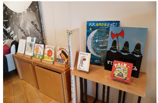
お子様向けの大きな絵本もご用意