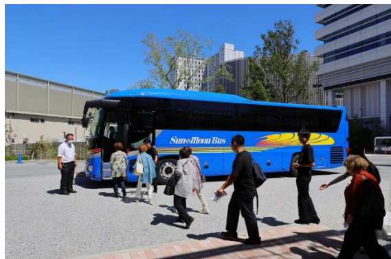
避難者バス移送実証実験の様子

本イベントは、1923年9月1日に発生した関東大震災から100年の節目を迎えるにあたり、激甚化する災害が発生した際に、江東区エリアでの広域避難シミュレーション、および地域防災計画、復興対策を事前に準備する目的で行われたものです。その一環として行われた当避難訓練では、避難拠点として指定されている江東区大島・北砂団地一帯での水害・洪水が発生した際に、臨海部・豊洲エリアへ避難するシミュレーションの一環として実施。清水建設株式会社と連携し、大新東所有の大型バスを用いて、大島四丁目団地の近くとなる江東区総合区民センターからミチノテラス豊洲までの区間移送(約7.7km)の実証実験を行いました。