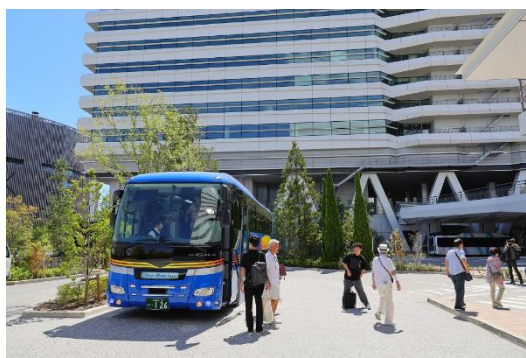
水害時事前避難訓練先(ミチノテラス豊洲)