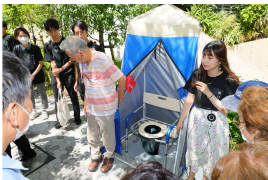
清水建設株式会社によるマンホールトイレの説明