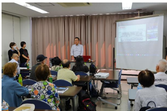
当社スタッフが江東区との災害協定を説明

「江東区と災害協定を締結していることは知らなかったが、こんな大型バスで移送できることを知り、驚きました。物資等も含め移送できる安心感があります」(60代女性)