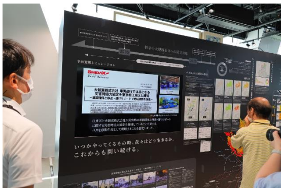
交通防災展示の様子

総合サービス企業 シダックスグループで、全国の民間企業の役員車、および自治体の公用車、貸切バス等の車両運行を行う大新東株式会社(以下:大新東)は、 2023年9月1日(金)、東京都江東区のミチノテラス豊洲、江東区総合区民センターにて行われた防災の日イベント「交通防災まちづくりにおける社会実験『明日の危機～関東大震災100年～』(主催:一般社団法人豊洲スマートシティ推進協議会)内の水害時事前避難訓練において、避難者をバスで移送する実証実験に協力しました。