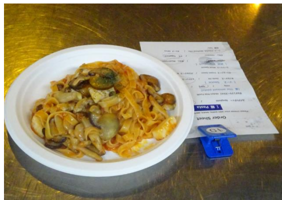
オーダーミール例 (トマトソース、ベーコン入り)

健康創造を標榜するシダックスグループは、同大会では2017年大会以来6年ぶりとなる食事提供業務の受託となり、本大会ではトータルアウトソーシング事業本部が本業務を担当。すべてのメニューを、 大規模な国際スポーツ祭典や公的機関等でトップアスリートへの食事提供実績・ノウハウを有し、公認スポーツ栄養士の資格を持つ当社の管理栄養士が作成。 開催期間トータルで約1,500食の食事を提供しました。