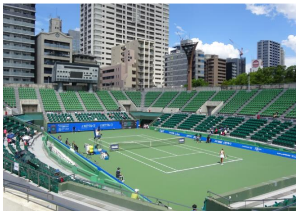
大会会場(ITC 韃テニスセンター)