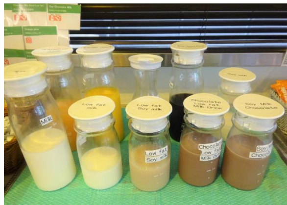
選手のご要望に応じ用意したドリンク類