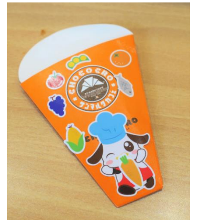
参加した子供たちが実際に作ったオリジナルスリーブ