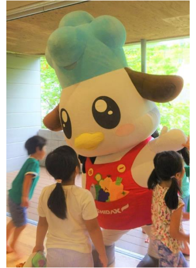
シダックスグループの食育キャラクター「モグちゃん」も参加。子どもたちに喜ばれました