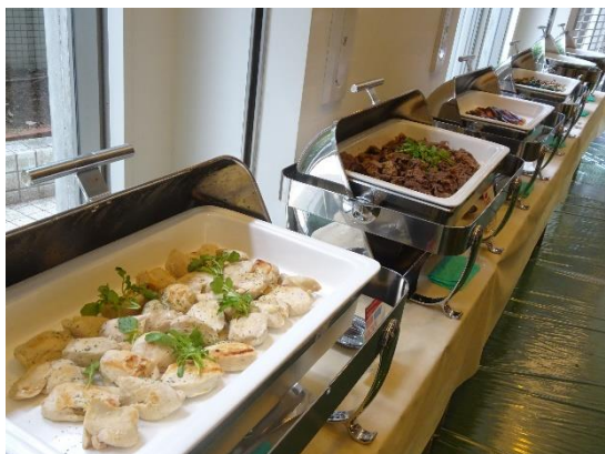
選手レストランのメニュー例

出場選手・コーチ・大会関係者用の選手レストランにて、ビュッフェスタイルで朝／昼・夜の2形態で、期間中で計約 1,500 食を提供。当社の公認スポーツ栄養士がすべてのメニューを作成するほか、主要栄養素・原材料をアイコンでわかりやすく表示するなど、きめ細やかなサービスで選手・関係者をサポートします。