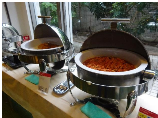
各国料理を用意(写真右はチリコンカン)