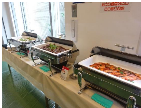
ビュッフェ形式の選手レストラン

シダックスグループは、同大会では2年連続となる食事提供業務の受託となり、トータルアウトソーシング事業本部が本業務を担当。すべてのメニューを、 大規模な国際スポーツイベントや公的機関等でトップアスリートへの食事提供実績・ノウハウを有する公認スポーツ栄養士(※)の資格を持つ当社の管理栄養士が作成し、期間中の食事提供を行います。