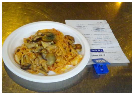
オーダーミール例

フードサービス、車両運行サービス、社会サービス等、事業を通じて社会課題解決を目指す総合サービス企業 シダックス株式会社 (本社:東京都渋谷区) は、 2024年10月12日(土)～10月20日(日) の期間、 モリタテニスセンター鞆(うつぼ) (大阪市西区)にて開催される、 WTA ツアー大会「木下グループ ジャパンオープンテニスチャンピオンシップス 2024」 (主催:公益財団法人日本テニス協会)にて、 選手・関係者向け食事提供業務(選手レストランの運営) を行います。