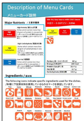
メニューカード説明で、主要栄養素・原材料をアイコンでわかりやすく表示