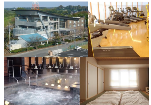
(2026 年 4 月)現在も受託運営している公共施設 「いこいの郷 常総」(茨城県守谷市)