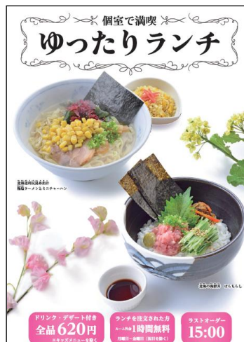
レストランカラオケ・ シダックス 「個室で満喫 ゆったりランチ」 メニュー表