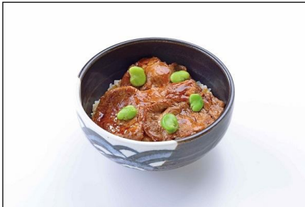
十勝ぶた丼 (味噌汁、サラダ付き)

「北海道ざんぎ定食」は、鶏肉をしっかり焼き揚げ、カリカリとした衣やジューシーな肉汁あふれるざんぎの特徴を再現。「お野菜たっぷりスープカレー」は、ナス、パプリカ、れんこんなどの野菜をふんだんに使い、器自体も熱々にした状態でご提供するピリ辛カレーです。