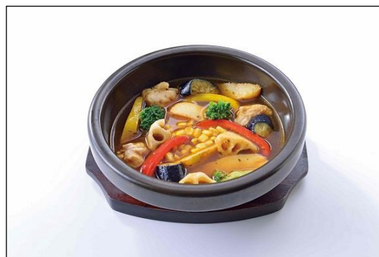
お野菜たっぷりスープカレー ※「ホリデーゆったりランチ」 <土・日・祝日/オープン~15:00(L.O)> では、本メニューは提供していません