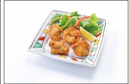
北海道ざんぎ定食 (ライス、味噌汁付き)