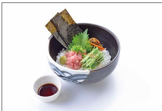
北海の海鮮丼 ばらちらし (味噌汁付き)