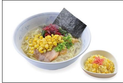
北海道利尻昆布出汁 極塩(きわみしお)ラーメンと ミニチャーハン