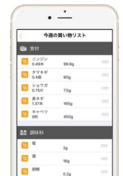
献立と人数を選ばだけで材料や分量がリスト化され、かつ自動計算されます