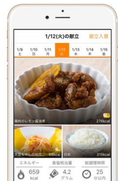
週1回、1週間分の献立をご提案

本アプリでは、WEB版「ソラレピ」のレシピ検索機能はもちろん、さらに時間を節約できる利便性を重視した独自の機能を追加しました。なお、ダウンロード料は無料で、かつ、WEB版ですでにプレミアム会員になられている方は、同じID、パスワードでログイン可能です。