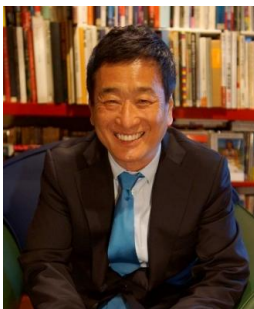
三枝成彰 (作曲家・東京音楽 大学客員教授)