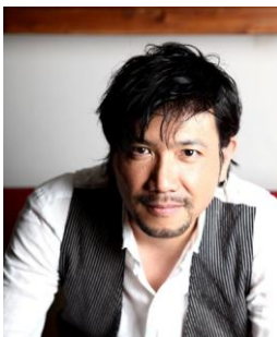
別所哲也 (俳優・「ショートショート フィルムフェスティバル & アジア」代表)