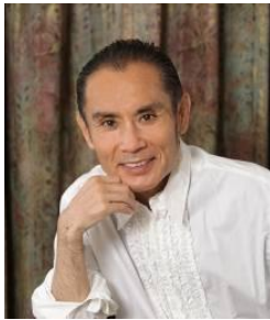
片岡鶴太郎 (俳優・書画家)