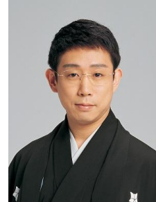
片岡孝太郎 (歌舞伎俳優)