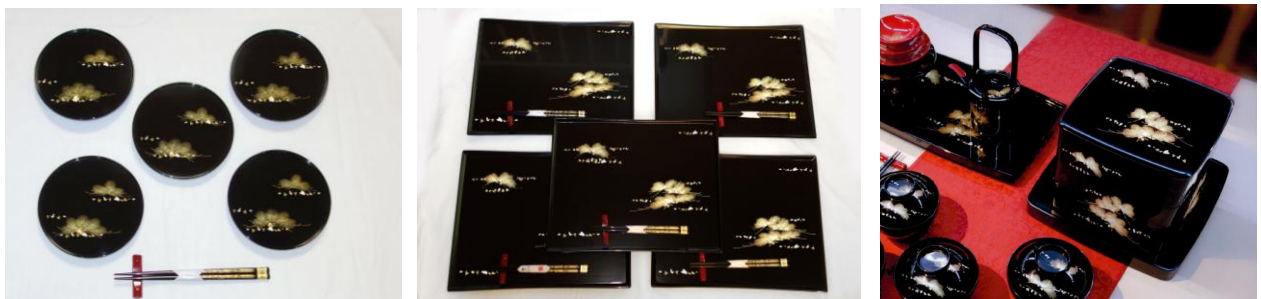
(写真左)輪島塗銘々皿 寿松沈金 5枚組 (写真中)輪島塗卓上膳 寿松沈金 5枚組