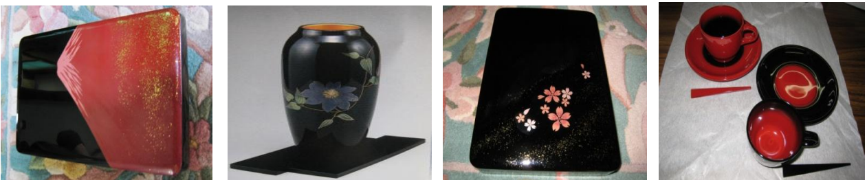
(写真左から)文庫 赤富士蒔絵／花器 つぼ型 鉄線蒔絵／硯箱 桜蒔絵／コーヒーカップ曙(朱・黒)2客