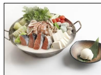
冬乳チーズ海鮮鍋