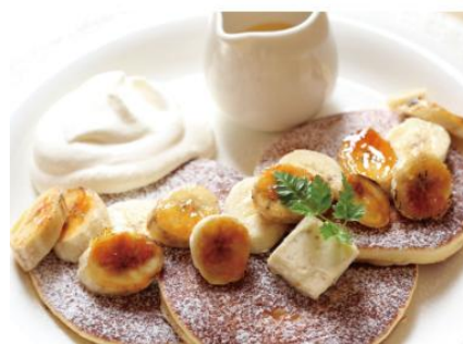
一番人気の「キャラメルバナナ」

「カフェ クッチーナ&カンパニー」のパンケーキは、バターミルクパウダーを加えてミルクィにしたオリジナル配合の生地にお卵を別立てにして加え、ふんわり、しっとりと仕上げています。バターには、百花蜜と胡桃を練り込んだ自家製ハニーバターを使用。シロップは、自家製オリジナルメープルシロップと塩キャラメルソースの2パターンがあり、シンプルなパンケーキを引き立てます。