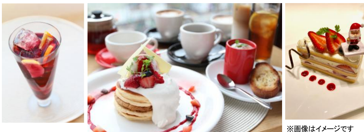
※画像はイメージです

総合サービス企業 シダックスグループが運営するカフェ「カフェ クッチーナ&カンパニー」(東京・渋谷)は、乾杯アルコールドリンク、カフェドリンク3品、アミューズ、パンケーキ、クリスマスケーキがセットになった贅沢なクリスマスプランのメニューを、2017年12月11日(月)～12月25日(月)の期間限定で提供いたします。