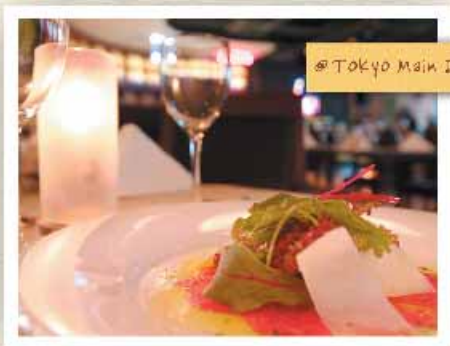
@Tokyo Main Dining

“ It's Delicious ! “ , “ It's Delight-ful ! “