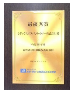
最優秀賞 賞状および表彰盾