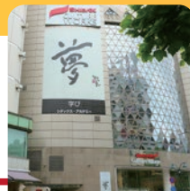
シダックス カルチャービレッジ